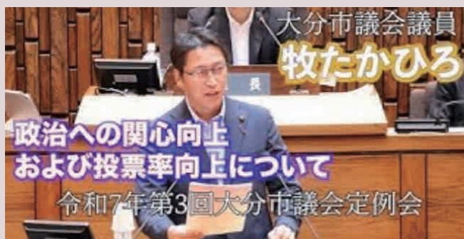
「政治への関心向上および投票率向上について」